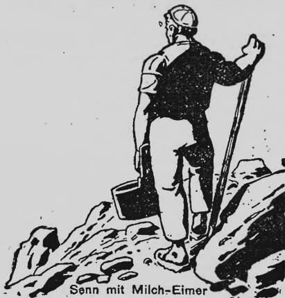
Sonn mit Milch-Eimer

Hafer-Milch-Kakao, Kakao, reiner, löslicher, in Verbindung mit Milch, Zucker, Hafer oder anderen Nahrungsmitteln oder chemischen Substanzen, Kinder- mehl und Kindermilch, kondensierte, sterilisierte oder humanisierte Milch, Milch in Pulverform mit und ohne Zutaten, Hafermehle, sowie andere Milch- Hafer- oder Mehlppräparate, Kindernährmittel, Schokoladen jeder Art, Kon- fiserie-Artikel, Zuckerwaren, Waffeln und sonstige Backwaren, Backpulver, Kaffees, Kaffee-Surrogate, Tees, Liköre, Mineralwässer, Limonaden, Gewürze, Zigarren, Zigaretten, Parfümerien, Mundwässer, pharmazeutische Spezial- itäten und damit in Verbindung stehende Reklame-Artikel.