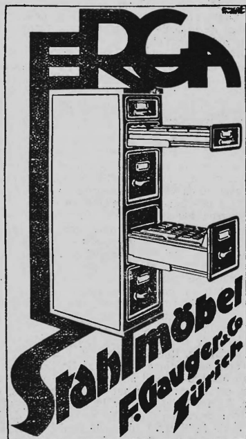
Schweiz- und Auslandspatente.

L'adoption à l'assemblée aura lieu sur présentation des actions ou de certificats nominatifs de dépôt.