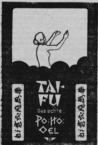
(Uebertragung der Nr. 66511 von W. Hübner-Lacher, Basel).

Pohoöl, Pohoöl-Präparate, Inhalationsapparate.