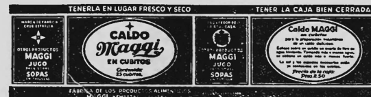
(Marque imprimée en rouge sur fond jaune).

Bouillons et consommés sous toutes formes, par exemple sous forme liquide, solide, pâteuse.