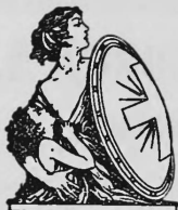
Fondée en 1858

Régie des annonces: PUBLICITAS Société Anonyme Suisse de Publicité