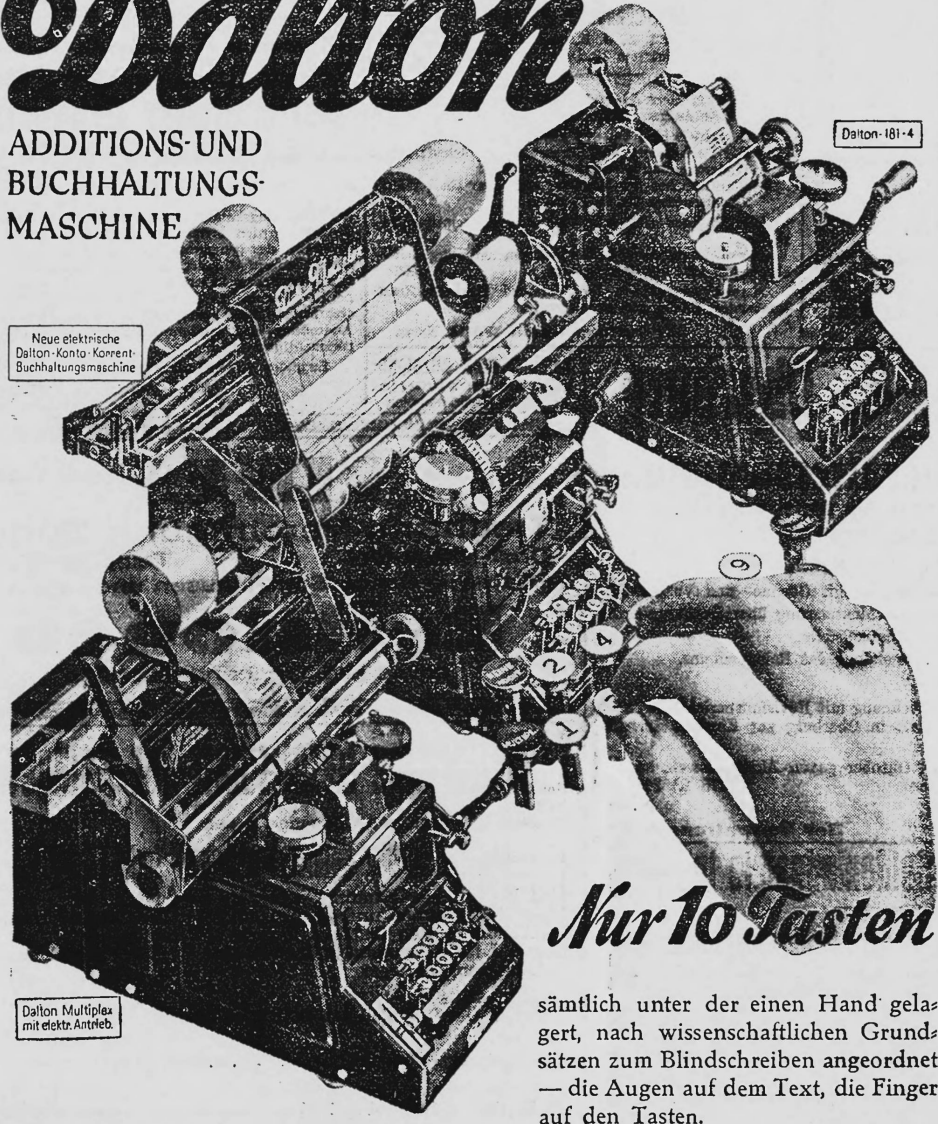
Neue elektrische Dalton-Konto-Korrent- Buchhaltungsmaschine