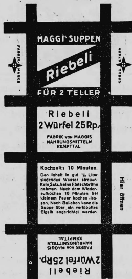
Farbenanspruch: gelb und rot.

Nr. 76711. — Hinterlegungsdatum: 21. Dezember 1931, 16 Uhr. Fabrik von Maggis Nahrungsmitteln, Fabrikation und Handel, Kempttal (Schweiz).