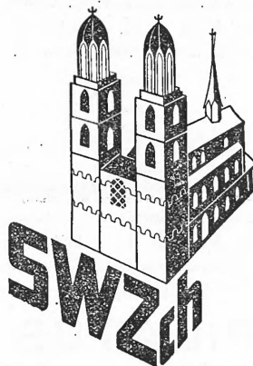
(Blauer Druck auf weissem Grund.)

Nr. 80813. — Hinterlegungsdatum: 2. August 1933, 17 Uhr. Spinnerei & Weberei Zürich A.-G. , Fabrikation, Stöckerstrasse 43, Zürich 2 (Schweiz). Gewebe aller Art.