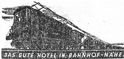
DAS GUTE HOTEL IN BAHNHOF-NAHE

Durch Inserate lesen, kam mancher auf Einfälle, die ihm Vorteile sicherten.