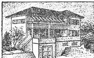
Traditionelle Chalets u. moderne Weekend-Häuser. 37-jährige Erfahrung. - Unverbindliche persönliche Beratung jederzeit.

PARQUET- & CHALETFABRIK A.-G. Sulgenbachstrasse 12, BERN, Telefon 22.116