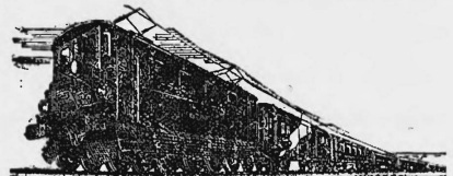
DAS GUTE HOTEL IN BAHNHOF-NAHE