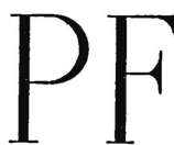
Abbildung der Stempelzeichen, die von den Fabrikanten von Edelmetallwaren zur Stempelung von Schmelzprodukten verwendet werden — Reproduction des poinçons servant à marquer les produits de la fonte par les fabricants d'ouvrages en métaux précieux — Riproduzione dei marchi che servono a marcare i prodotti della fusione dai fabbricanti di oggetti di metallo prezioso.

Pauli Frères, fabrique de boîtes de montres