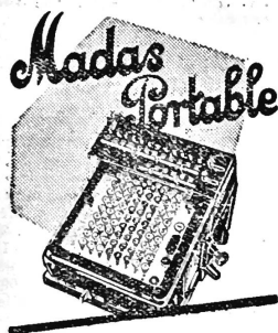
2486° Standard- und Portable-Modelle

Additions- & Rechenmaschinen A.-G. Zürich, Bahnhofpl. 9, (Victoria), Tel. 70.133 u. 70.134