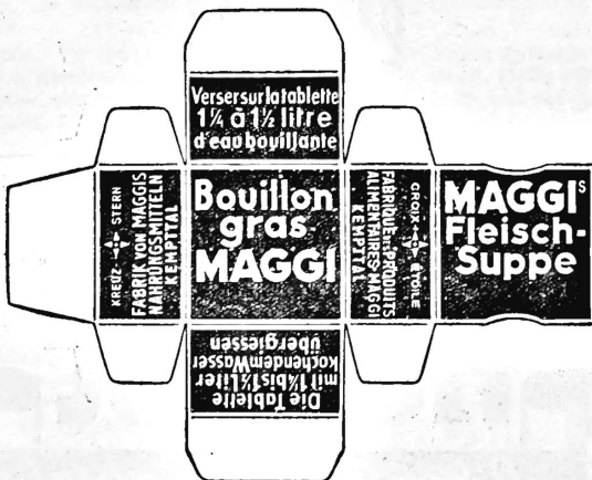
(Die Marke wird gelb und rot ausgeführt.)

N° 90313. Date de dépôt: 3 avril 1937, 4 h. Fabrique des Produits alimentaires Maggi, Kempttal (Suisse). Marque de fabrique et de commerce.