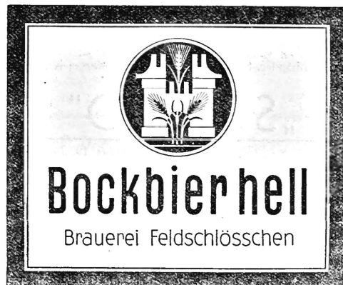
(Die Marke wird gelb, gold, grün und schwarz ausgeführt.)