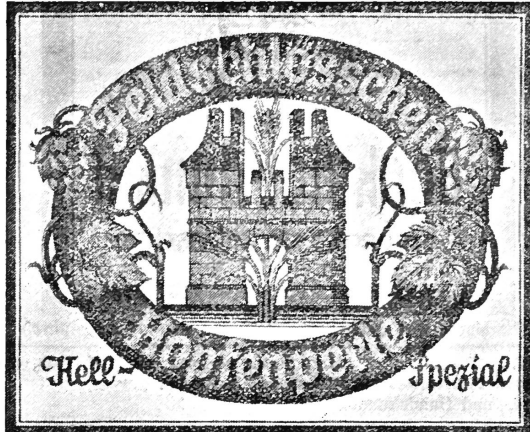
(Die Marke wird rot, gold, grün, schwarz, gelb ausgeführt.)

Nr. 93367. Hinterlegungsdatum: 12. Juni 1938, 4 Uhr. Brauerei Feldschlösschen, Rheinfelden (Schweiz). Fabrik- und Handelsmarke.