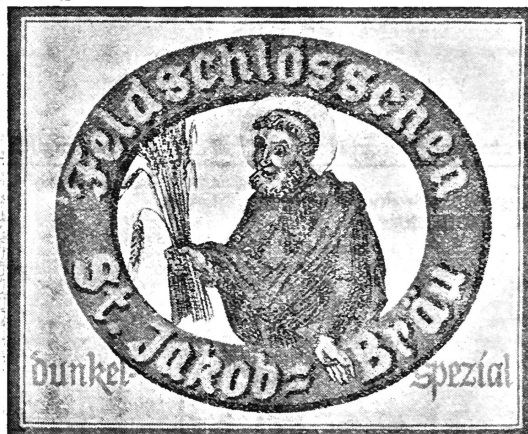
(Die Marke wird braun, gold, gelb, schwarz ausgeführt.)

Nr. 93368. Hinterlegungsdatum: 12. Juni 1938, 4 Uhr. Brauerei Feldschlösschen, Rheinfelden (Schweiz). Fabrik- und Handelsmarke.