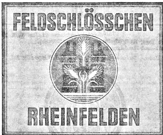
(Die Marke wird gelb, gold, schwarz und rot ausgeführt.)

Nr. 93366. Hinterlegungsdatum: 12. Juni 1938, 4 Uhr. Brauerei Feldschlösschen, Rheinfelden (Schweiz). Fabrik- und Handelsmarke.