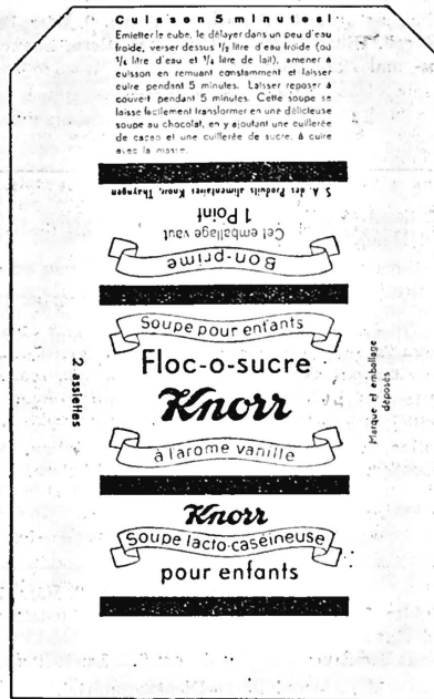
(Die Marke wird in weiss, schwarz, gelb und braun ausgeführt.)

Mit Zucker und Milcheiweiss zubereitete Suppen mit Vanillegeschmack.