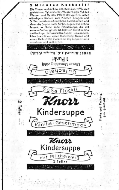
(Die Marke wird in weiss, schwarz, gelb und braun ausgeführt.)

Mit Zucker und Milcheiweiss zubereitete Suppen mit Vanillegeschmack.