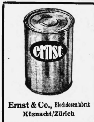
Ernst & Co., Blechdosenfabrik Küsnacht/Zürich