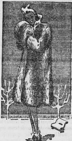
Der beste Wärmepantel aus langhaariger Riga-Wolle