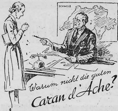
DIE SCHWEIZER BLEISTIFTE