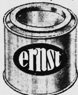
Ernst & Co Blechdosenfabrik Künznacht (Zürich)

Inserate haben im Schweiz. Handelsamtsblatt hesten Erfolg.