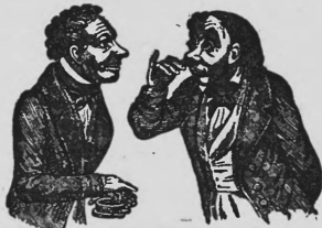
Wie finden Sie ihn? — Delikat! — Famous!

Nr. 106244. Hinterlegungsdatum: 25. Januar 1944, 17 1/2 Uhr. Bürstenfabrik Walther AG., Oberentfelden (Schweiz). Fabrik- und Handelsmarke. — (Erneuerung der Marke Nr. 55772. Die Schutzfrist aus der Erneuerung läuft vom 25. Januar 1944 an.)