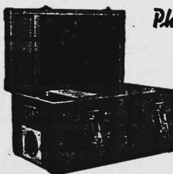
Supercop I 25x36 cm Supercop II 36x46 cm