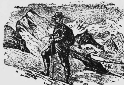
Guide de Montagne. — Bergführer.

N° 121131. Date de dépôt: 15 juillet 1947, 18 h. Bernalpen Milchgesellschaft (Société Laitière des Alpes Bernoises) (Bernese Alps Milk Co.), Konolfingen (Berne, Suisse). Marque de fabrique et de commerce. — Renouvellement de la marque N° 65001. Le délai de protection résultant du renouvellement court depuis le 6 juillet 1947.