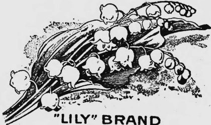
"LILY" BRAND Marca "Lirio" — Marke "Maiblume" Marque "Muguet"

Lait et produits laitiers, chocolat et produits chocolatiers, cacao et produits de cacao.