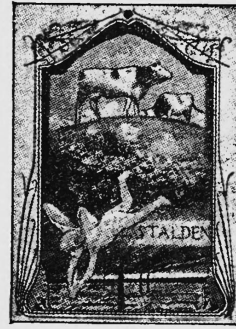
MESSAGER des ALPES - ALPENBOTE

zeuge, Fahrzeuge, Erzeugnisse der Spinnerei und Weberei, Reklameartikel, Maschinen und Maschinenbestandteile, Drucksachen, bildliche Darstellungen.