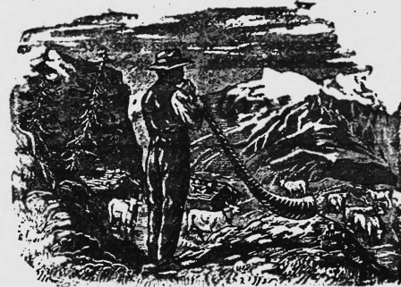
Gor des Alpes. — Alphorn.

N° 121129. Date de dépôt: 15 juillet 1947, 18 h. Bernalpen Milchgesellschaft (Société Laitière des Alpes Bernoises) (Bernese Alps Milk Co.), Konolfingen (Berne, Suisse). Marque de fabrique et de commerce. — Renouvellement de la marque N° 64997. Le délai de protection résultant du renouvellement court depuis le 6 juillet 1947.