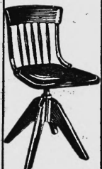
Mod. 2: Fr. 76.- beste Qualität