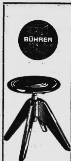
Mod. 1: Fr. 49.-

Zu kaufen gesucht: Kaliumpermanganat technisch rein Z 67 für sofortige und spätere Lieferung. - Offerten unter Chiffre O 6154 Z an Publicitas Zürich.