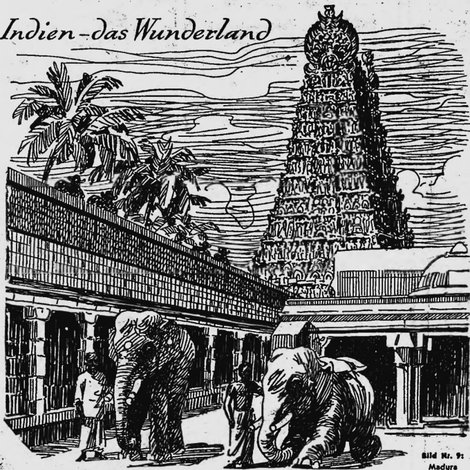
Bild Nr. 91 Madure

Indiens Märchenwelt, mit seinen marmorweißen Palästen und Denkmälern, seinen zauberhaften Pagoden, war für den Europäer von jeher ein Land der Sehnsucht und Träume. Wir sind durch die