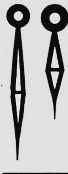
No. 2108 No. 1910