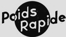
Tableau comparatif pour poids du bétail.

N° 131772. Date de dépôt: 2 novembre 1949, 9 h. Alexandre Portlanucha Laboratoire Diamant, rue de la Tour 2, Genève (Suisse). — Marque de fabrique et de commerce.