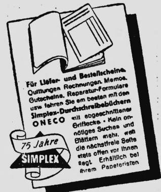
Schreibbücherei Simplex AG Bern