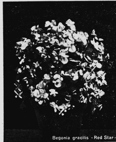
Begonia gracilis - Red Star

Nr. 134607. Hinterlegungsdatum: 22. Juli 1950, 13 Uhr. Gustav Renfer, Zwinglistrasse 16, Bern (Schweiz). Fabrik- und Handelsmarke.