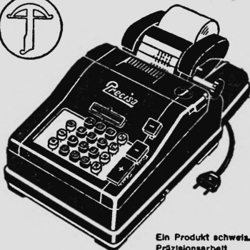
Ein Produkt schweiz. Präzisionsarbeit