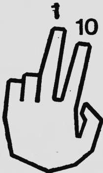
Zwei-Finger-Methode SYSTEM TRACHTENBERG

Abzeichen, Broschüren, Bücher, Drucksachen, Tabellen, Rechenmittel, Rechengeräte, Rechenmaschinen, Kontrollmittel, Kontrollgeräte und Kontrollmaschinen für alle Rechenoperationen.