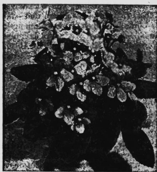
BLAUES MÄRCHEN - F-1 - HYBRIDE

Blumensamen Saintpaulia ionantha grandiflora (Usambara-Veilchen).