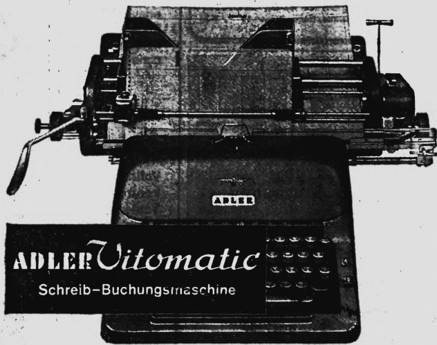
ADLER Vitomatic Schreib-Buchungsmaschine

Mit verbundenen Augen können Sie die Kontenkarte schreibfertig, zeilengerade und auf die richtige Buchungszelle einstellen. Kein Richten — ein Hebelzug genügt!