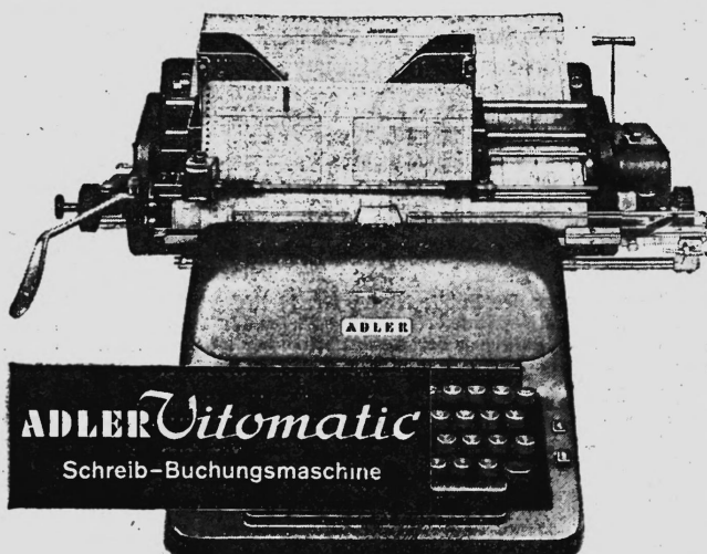
ADLER Vitomatic Schreib-Buchungsmaschine

Mit verbundenen Augen können Sie die Kontenkarte schreibfertig, zeilengerade und auf die richtige Buchungszeile einstellen. Kein Richten — ein Hebelzug genügt!