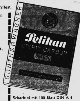
Schachtel mit 100 Blatt DIN A 4

Bei den Sorten 994 wird die saubere Handhabung durch eine zusätzliche Schutzschicht noch verbessert.