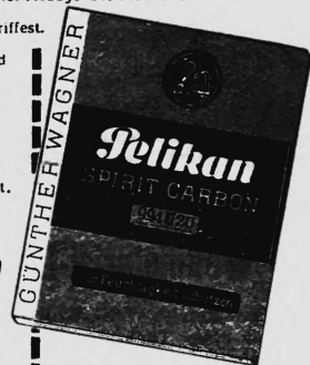
Schachtel mit 100 Blatt DIN A 4