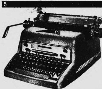
Modelle ab Fr. 1095.-