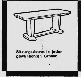
Sitzungstische in jeder gewünschten Grösse

Das Formpult unterscheidet sich von den früher gebräuchlichen Pulten und Schreibtischen durch vollständig neue Linienführung, verbunden mit zeitloser Eleganz und grösster Zweckmässigkeit. Es ist nach einem Spezialverfahren — Hochfrequenzverleimung und Formpressung — hergestellt und hat so ein um 25% geringeres