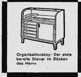
Organisationsboy: Der stets bereite Diener im Rücken des Herrn