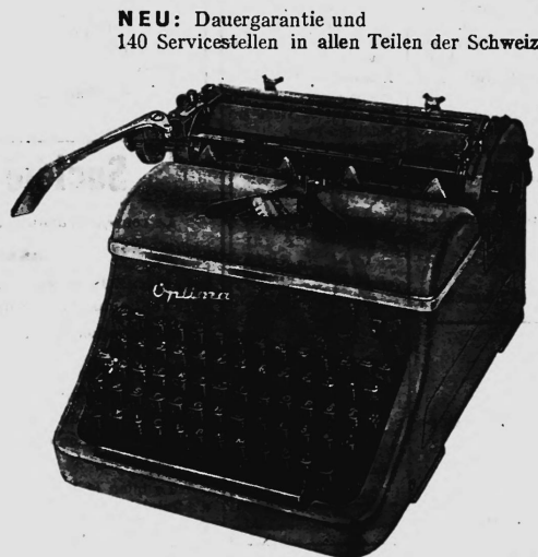
NEU: Dauergarantie und 140 Servicestellen in allen Teilen der Schweiz

Alfred Bühler Bexima AG., Schaffhausen, Telefon (053) 5 58 88 und 5 22 30