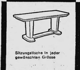
Sitzungstische in jeder gewünschten Grösse

Wichtig! Kennen Sie schon unseren Büromöbel-Service? Unsere Schreiner stehen Ihnen für Reparaturen jederzeit zur Verfügung!