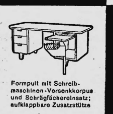
Formpult mit Schreibmaschinen-Versenkkorpus und Schrägfächerersatz; aufklappbare Zusatzstütze

Facit-Vertrieb AG Zürich 1 Selnaustrasse 6 Tel. 051/27 58 14