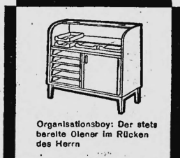
Organisationsboy: Der stets bereite Olenar im Rücken des Herrn

Das Formpult unterscheidet sich von den früher gebräuchlichen Pulten und Schreibtischen durch vollständig neue Linienführung, verbunden mit zeitloser Eleganz und grösster Zweckmässigkeit. Es ist nach einem Spezialverfahren — Hochfrequenzverleimung und Formpressung — hergestellt und hat so ein um 25% geringeres