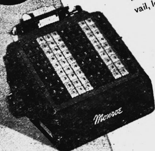
Machine à additionner Duplex modèle 410-11-092

S. A. POUR MACHINES A ADDITIONNER ET A CALCULER ZÜRICH 23 Bahnhofplatz 9 Téléphone 051/27 01 33