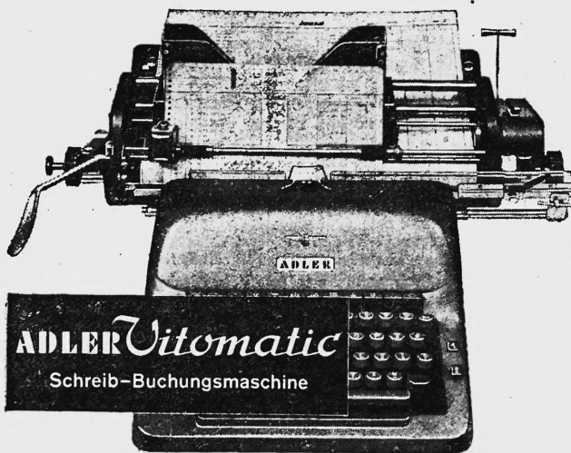
ADLER Vitomatic Schreib-Buchungsmaschine

Mit verbundenen Augen können Sie die Kontenkarte schreibfertig, zeilen gerade und auf die richtige Buchungszeile einstellen. Kein Richten — ein Hebelzug genügt!