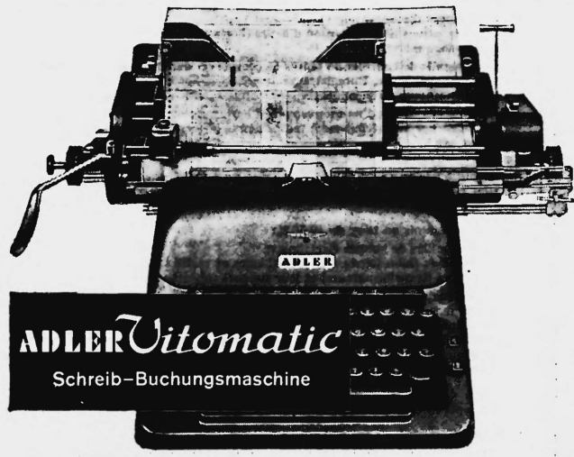
ADLER Vitomatic Schreib-Buchungsmaschine

Mit verbundenen Augen können Sie die Kontenkarte schreibfertig, zeilengerade und auf die richtige Buchungszeile einstellen. Kein Richten — ein Hebelzug genügt!