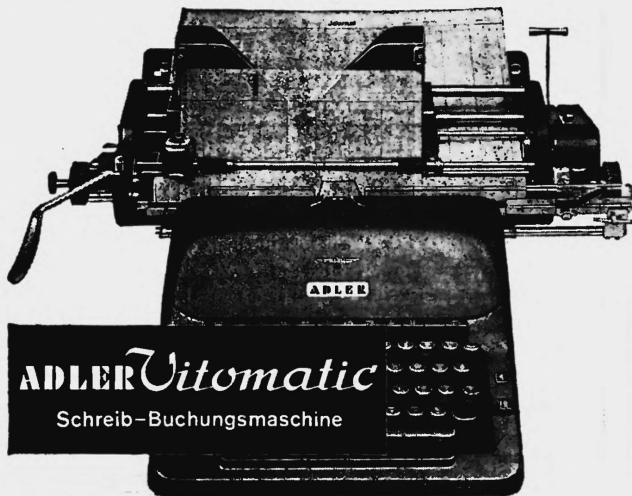
ADLER Vitomatic Schreib-Buchungsmaschine

Mit verbundenen Augen können Sie die Kontenkarte schreibfertig, zeilengerade und auf die richtige Buchungszeile einstellen. Kein Richten — ein Hebelzug genügt!