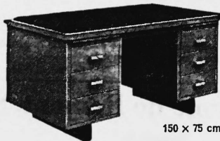
150 x 75 cm