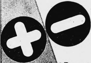
Machine à additionner Duplex modele 410-11-092

Pour obtenir le meilleur rendement donnez la préférence aux machines comptables et à additionner MONROE. Vous apprécierez la rapidité de leur travail, leur souplesse et leur simplicité.