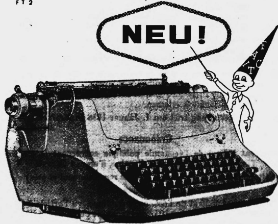
ab Fr. 785.-