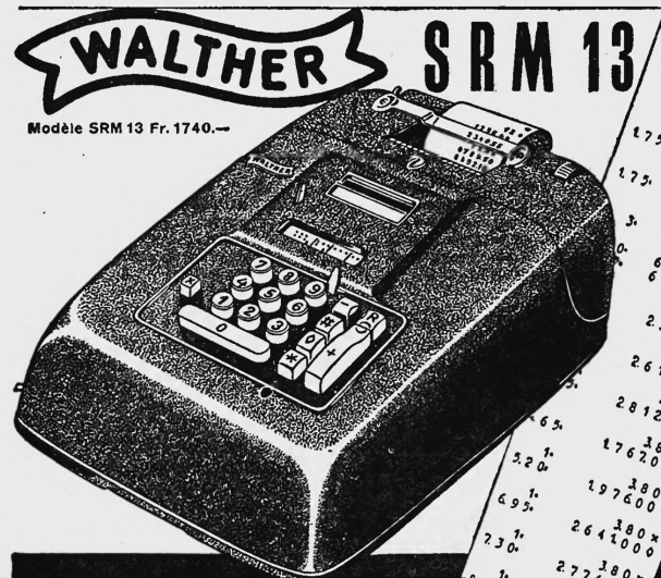
Modèle SRM 13 Fr. 1740.—

Rapide - simple pratique Deux machines en une seule!