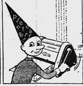
Während des Mittagessens wird das Protokoll in 60 Exemplaren auf dem PLENTOGRAF vervielfältigt — direkt ab Original.