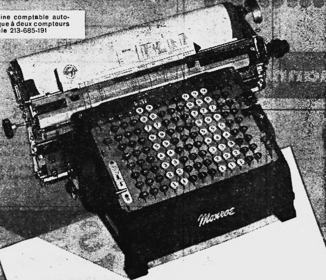
Machine comptable automatique à deux compteurs modèle 213-685-191

Pour obtenir le meilleur rendement donnez la préférence aux machines comptables et à additionner MONROE. Vous apprécierez la rapidité de leur travail, leur souplesse et leur simplicité.