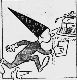
Die Diskussion wird stenografiert, das Protokoll nachher auf der Maschine getippt.