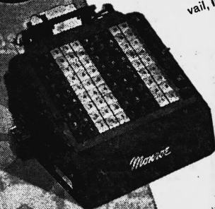
Machine à additionner Duplex modèle 410-11-092

S. A. POUR MACHINES A ADDITIONNER ET A CALCULER ZÜRICH 23 Bahnhofplatz 9 Téléphone 051/27 01 33