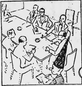
Konferenzen mit Teilnehmern aus dem ganzen Lande. Wichtige Fragen stehen auf dem Programm.