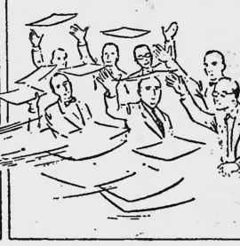
Nachdem die Verhandlungen wieder aufgenommen werden, erhalten sämtliche Teilnehmer ein plentografiertes Exemplar des Protokolls über die Vormittags-Sitzung.