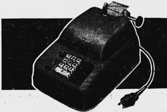
OLYMPIA Saldiermaschinen - mit Negativ-Saldo, Hand-, elektr. oder komb. Antrieb ab Fr. 695.-