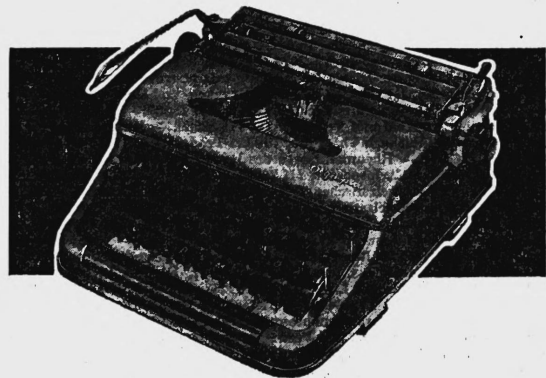
OLYMPIA Portables - stabil und leicht transportabel Mod. SM 2 Fr. 455.- / Mod. SM 3 (mit Tab.) Fr. 495.-

Ob für Schreiben oder Rechnen, ob für Büro, Heim oder Reise - stets bietet das reichhaltige OLYMPIA-Programm das richtige Modell. Zahlreiche Exklusivvorzüge erleich- tern und beschleunigen die Arbeit.