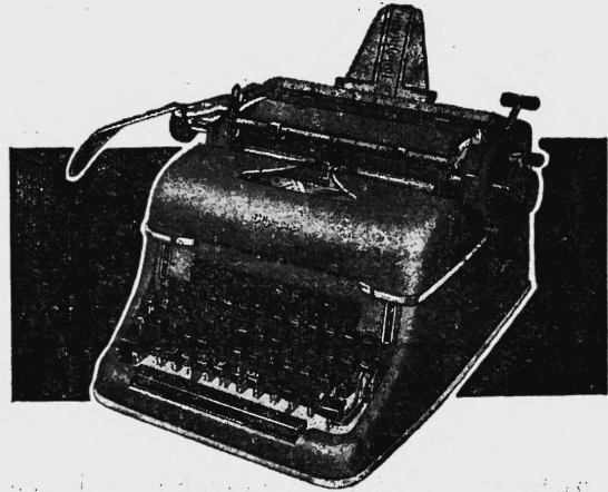
OLYMPIA SG 1 - die vielseitige Büromaschine als Super- oder Korrespondenzmodell ab Fr. 880.-