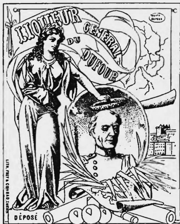
Le «Couronnement» du Général Dufour — Die «Krönung» des Generals Dufour (16. 8. 1883)

L'historien y trouvera maints aspects de la petite comme de la grande histoire. C'est ainsi que les colonnes de la Feuille officielle suisse du commerce ont elles aussi fixé pour la postérité le portrait des trois premiers généraux de notre histoire, portraits destinés à figurer sur d'innombrables bouteilles de liqueur, paquets de cigares ou autres produits.