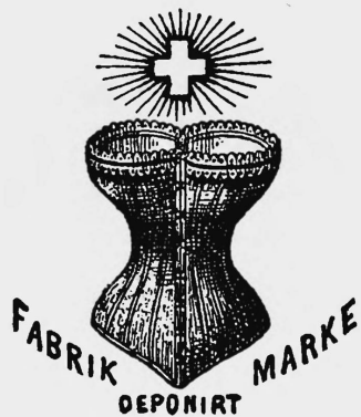
(25. 6. 1889) Les marques aujourd'hui condamnées — Heute nicht mehr zulässige Marken (10. 11. 1883)

De même, depuis l'adoption de la loi de 1910, l'extrait d'absinthe que plusieurs marques annonçaient en lettres majuscules ne fut plus par la suite qu'une verte, une bleue, une coueste ou autre produit de remplacement semblable.