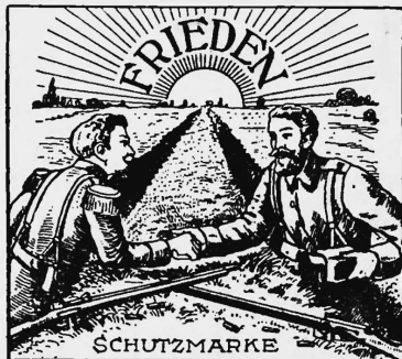
Espoir prématuré — Verfrühte Hoffnung (8. 9. 1915)

Beim Durchblättern der Markensammlung wird der Historiker die beiden Weltkriege im Bild wiedererleben, mit all ihren Uniformen und verschiedensten Waffen.