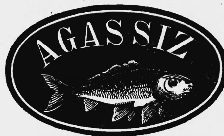
Les deux marques les plus anciennes (N os 10 et 22) dont l'enregistrement a été régulièrement — croix fédérale mise à part — renouvelé jusqu'à ce jour (N os actuels 105640 et 98329) Die beiden ältesten Marken (Nrn. 10 und 22), deren Eintragung bis auf den heutigen Tag regelmäßig — unter Weglassung des Schweizer Wappens — erneuert wurde (gegenwärtige Nrn. 105640 und 98329)

L'augmentation du chiffre annuel des enregistrements, qui était de moins de 300 à l'origine et se situe aujourd'hui autour de 4500, chiffre auquel s'ajoutent chaque année quelque 8000 marques internationales, protégées en Suisse au même titre que les marques nationales, illustre de façon saisissante le développement considérable de l'industrie et du commerce au cours de ces 75 dernières années, tant sur le plan interne qu'international, et l'importance de plus en plus grande que revêtent dans les relations commerciales les marques de fabrique et de commerce.