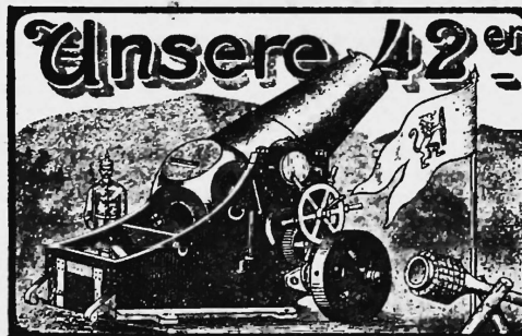
La Grosse Bertha — Die Dicke Berta (27. 11. 1914)

Il se remémorera l'inauguration du Transsibérien, assistera à l'apparition des premiers tramways, du phonographe, du téléphone ou de la bicyclette; il admirera au passage les premiers «aéroplanes» et évoquera les voyages des dirigeables Zeppelin, la construction de la Tour Eiffel, le percement du tunnel du Simplon, le lancement du Titanic, la construction du chemin de fer de la Jungfrau, terminant cette revue par les soucoupes volantes et les récents Sputniks.