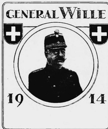
Le portrait du Général Wille — Bildnis des Generals Wille (6. 4. 1915)

Un peu toutes les grandes vedettes de la politique, des sciences et des arts ont tour à tour, au fur et à mesure de leur apparition dans le ciel de la gloire, été appelées à sacrifier de la même façon sur l'autel de Mercure, depuis l'Empereur Guillaume I er , en passant par le Maréchal Joffre, jusqu'à Winston Churchill ou Monty, sans parler de nombre de nos anciens conseillers fédéraux tels que Ruchonnet ou Motta; depuis Pasteur jusqu'à Sauerbruch; depuis Charlie Chaplin jusqu'à Lawrence Oliver.