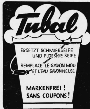
Les produits de remplacement en 1941 — Ersatzprodukte im Jahr 1941 (25. 10. 1941)