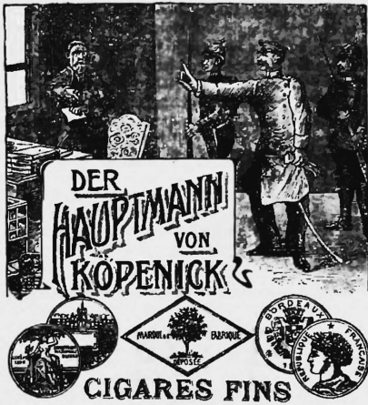
La célèbre affaire du Capitaine de Köpenick qui en 1906 secoua l'Europe d'un rtre homérique Die Köpenickiade (13. 12. 1906)

So wird er auch feststellen können, dass die Affäre des Hauptmanns von Köpenick einen Zigarrenfabrikanten inspiriert hat, lange bevor sie den Stoff zu einem Roman lieferte oder auf der Bühne aufgeführt wurde.