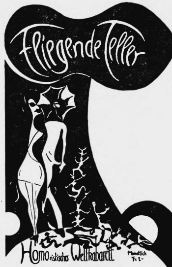
L'apparition des soucoupes volantes — Das Auftauchen der Fliegenden Teller (8. 3. 1955)

Le spécialiste en publicité trouvera ample matière à réflexion sur l'évolution de l'art graphique au cours de ces 75 années.