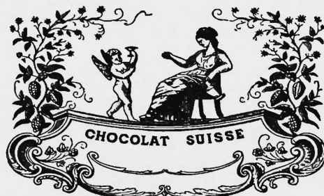
La première marque publiée par la FOSC., portant le N° 848 — Erste im SHAB. veröffentlichte Marke, Nr. 848 (8. 12. 1882)*

Am 13. November 1880 veröffentlichte das «Eidgenössische Amt für die Fabrikmarken in Bern (Eidg. Handels- und Landwirtschaftsdepartement)», das kurz vorher durch das Bundesgesetz vom 19. Christmonat 1879 betreffend den Schutz der Fabrik- und Handelsmarken ins Leben gerufen worden war, als Anhang zum Bundesblatt die erste Serie von Marken, welche die Nummern 1 bis 847 tragen und vom Amt «am 1. November 1880, 8 Uhr Vormittags eingetragen» worden waren. Als dann anfangs 1883 das Schweizerische Handelsamtsblatt zu erscheinen begann, wurde dieses als Publikationsorgan des Amtes — das 1888, nach dem Inkrafttreten des ersten Patentgesetzes, den Namen «Eidgenössisches Amt für geistiges Eigentum» erhielt — für die bei ihm eingetragenen Marken und später auch für die Patenterteilungen und Musterhinterlegungen bezeichnet. Von der Nummer 848 vom Januar 1883 bis zur Nummer 168 186, veröffentlicht am 30. Dezember 1957, sind es nun mehr als 167 000 Marken, einschliesslich Erneuerungen, die in diesen letzten 75 Jahren in den Spalten des Schweizerischen Handelsamtsblattes veröffentlicht wurden und diesem antiken Blatt eine Illustration origineller Art vermittelt haben.