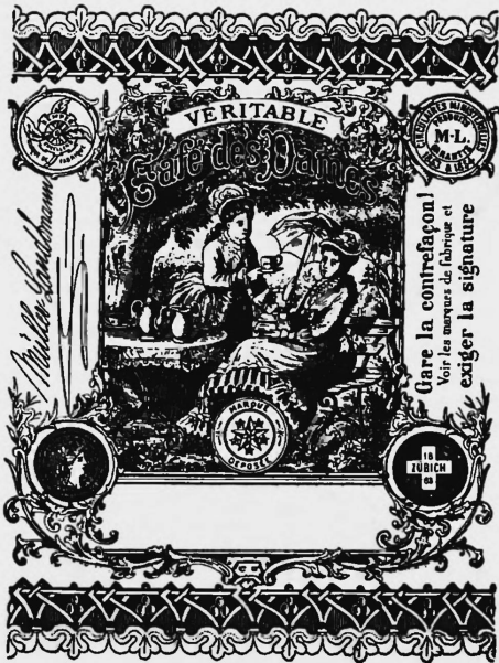
(27. 6. 1885) Les arts appliqués hier et aujourd'hui — Die angewandte Kunst gestern und heute (9. 2. 1955)

Es wird ihm auffallen, dass am Anfang und noch während längerer Zeit die Marken vorwiegend aus bildlichen Darstellungen bestanden haben, während heute die reinen Wortmarken die weitaus grösste Zahl der zur Hinterlegung gelangenden Zeichen bilden. Vom 1. November 1880 an, dem Tag der ersten Markenhinterlegung, sind mehr als 10 Jahre verstrichen, bis erstmals am 4. Juli 1891 ein reines Phantasiewort als Marke auf den Namen einer Schweizer Firma hinterlegt wurde («Knodalin», Marke Nr. 5352).